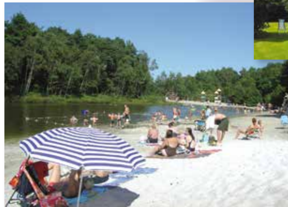
Badesee und Strand