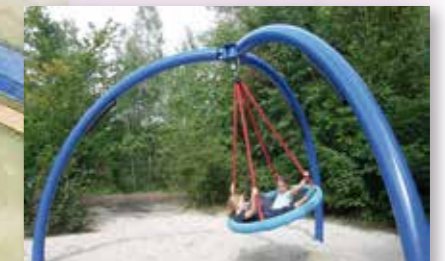
Spielen, klettern und heruntollen