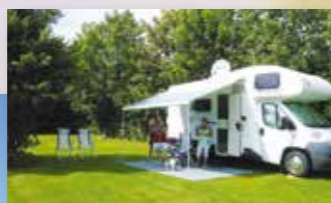
Plätze für Wohnmobile