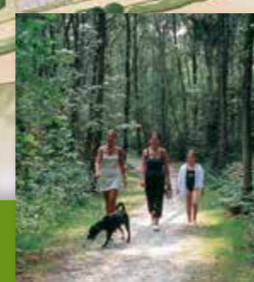
Wandern im Wald