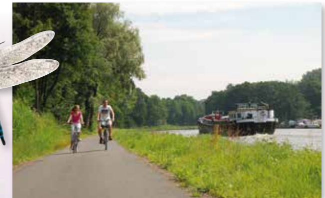
Radfahren entlang des Kanals Dessel – Schoten