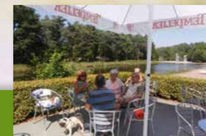
Terrasse am Badesee